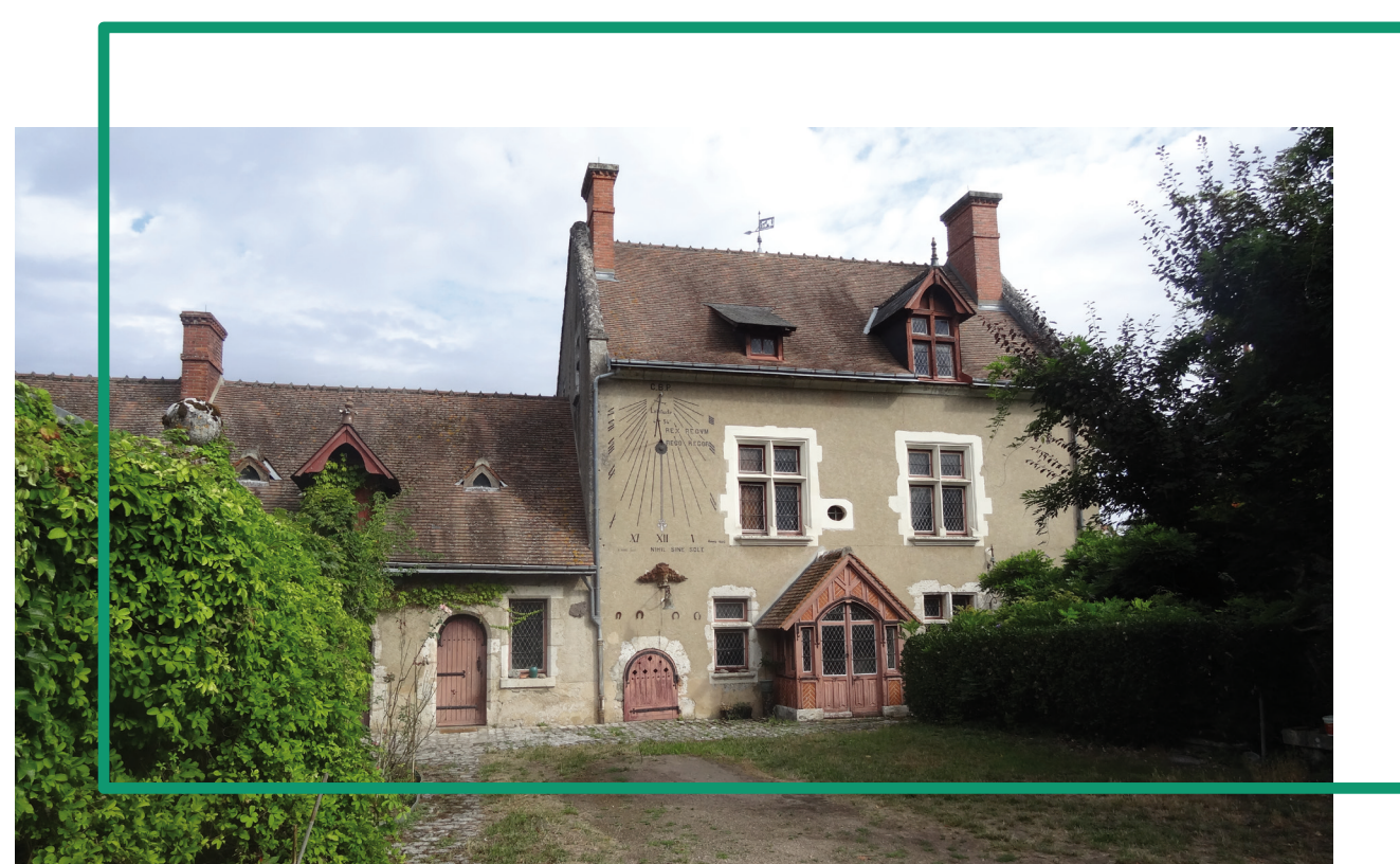
Maison Renaissance (adresse)

Ce parcours est présenté sous forme d'un cheminement en 23 étapes, jalonné de panneaux explicatifs. Vous pourrez, au gré d'une balade de 7,3 km (2h environ), vous imprégner de l'histoire locale, côtoyer Robert-Houdin, le célèbre magicien, ou partager la bonne crème de Saint-Gervais qui a fait la renommée de la commune. Suivez la laitière qui sera votre guide tout au long du parcours.