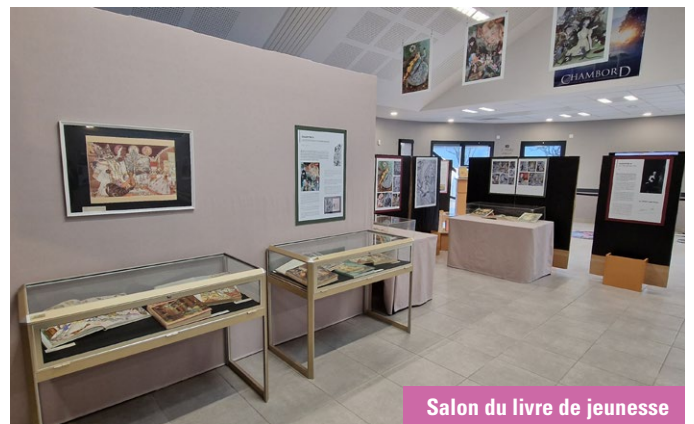
Salon du livre de jeunesse