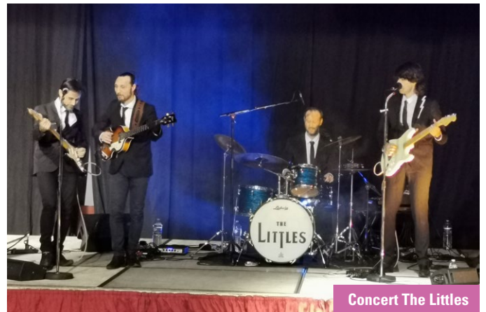
Concert The Littles