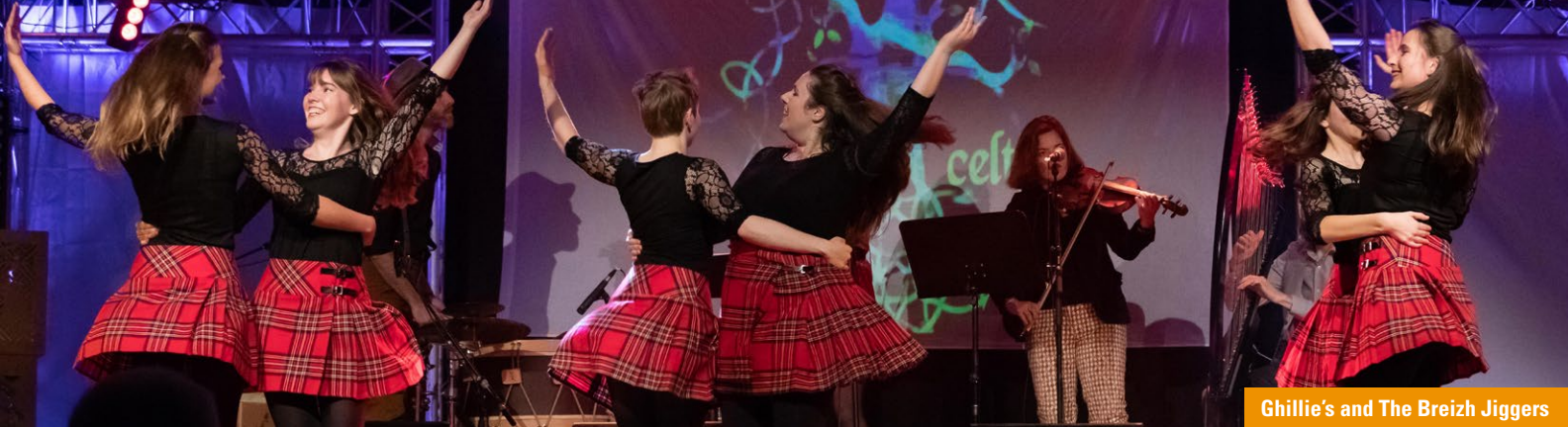
Ghillie's and The Breizh Jiggers