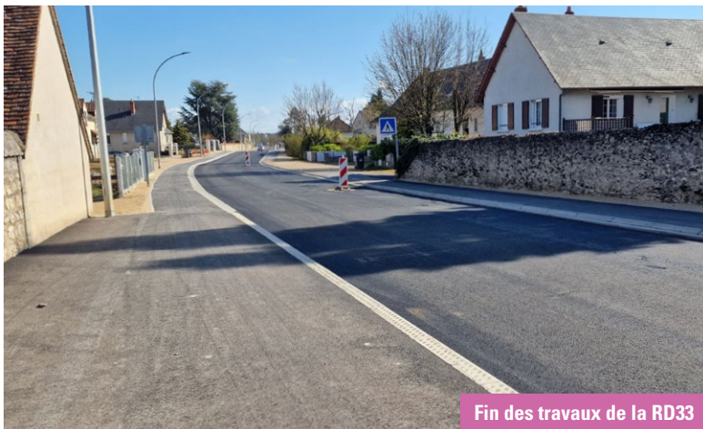
Fin des travaux de la RD33