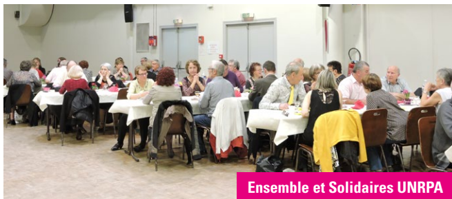
Ensemble et Solidaires UNRPA

L'Association Ensemble et Solidaires (UNRPA) rassemble actuellement 195 adhérents, principalement composés de retraités et de personnes âgées. Elle propose des spectacles, des bals, des concerts, des sorties d'1 ou 2 jours, des séjours d'une semaine, des repas à thème selon les demandes. L'association encadre des marches tous les mardis matin en forêt à partir de 9h30. (3. 5 et 8 kms) ainsi que des jeux tous les mardis après-midi de 14h à 17h30 au 1 rue du Bourg.