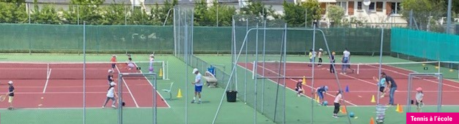
Tennis à l'école