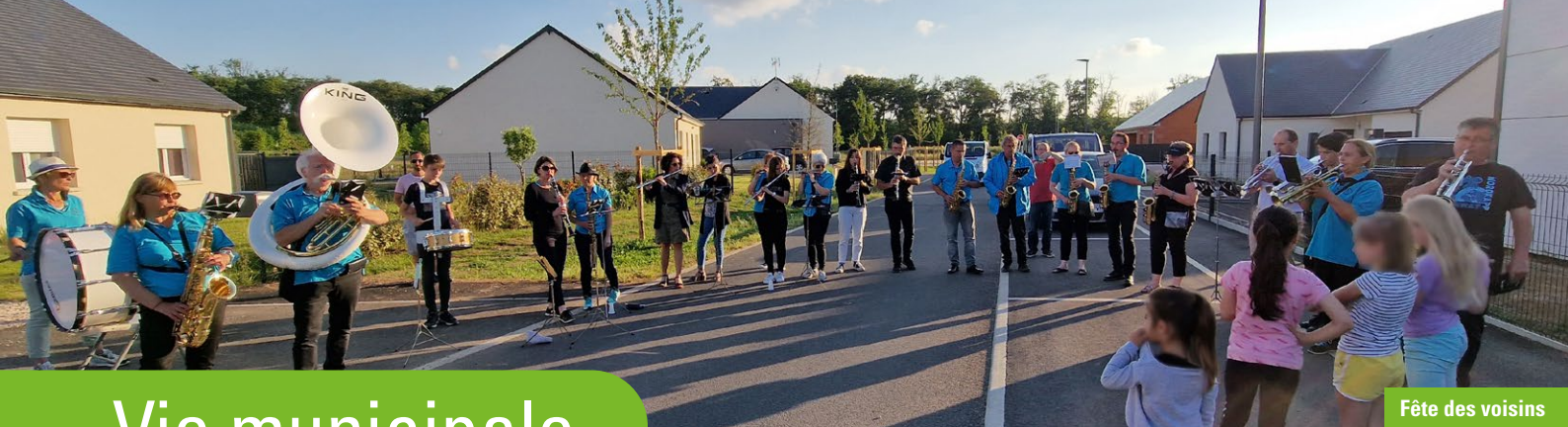
Fête des voisins