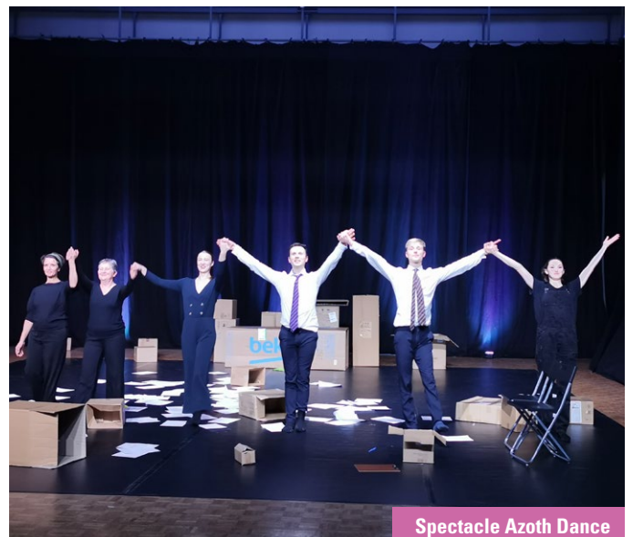
Spectacle Azoth Dance