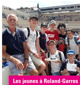
Les jeunes à Roland-Garros

Le Tennis Club renoue progressivement avec ses activités. Un temps fort a été marqué par le tournoi OPEN de juin qui a pu reprendre après une interruption de deux ans. 136 joueurs et joueuses du Loir-et-Cher sont venus disputer les rencontres sportives et ont retrouvé la convivialité