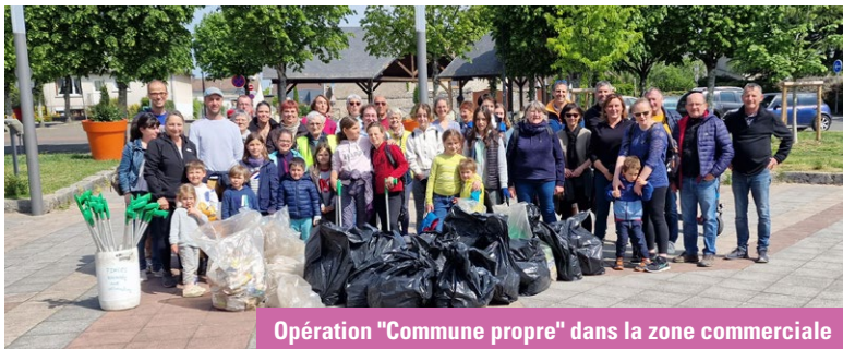
Opération "Commune propre" dans la zone commerciale