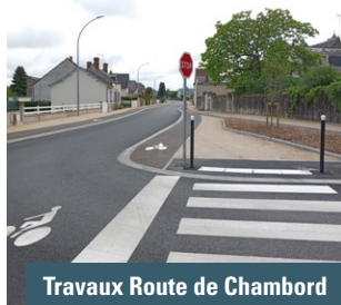
Travaux Route de Chambord

Les travaux, débutés mi-septembre 2021, sont désormais terminés avec la création de pistes cyclables et la réfection de la chaussée. La réception a été finalisée fin mai 2022. L'entreprise BSTP a réalisé les travaux de voirie et le marquage a été effectué par ESVIA (sur les pistes et quais bus) et par TPC SIGNALISATION (pour les passages piétons et bandes stop des rues adjacentes).