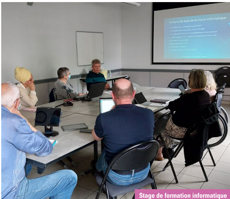
Stage de formation informatique