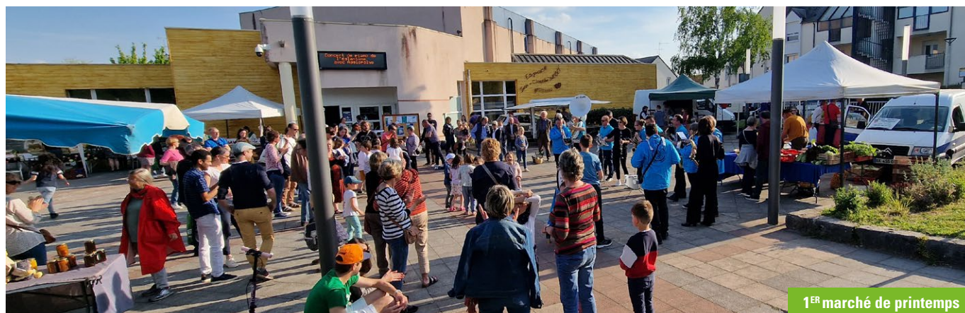
1 er marché de printemps

Soutenir notre vivier associatif, animer la commune, faire se rencontrer les gervaisiennes et les gervaisiens, faire connaître aussi notre ville par sa convivialité et par son esprit de découverte... telles sont les missions de la commission vie associative et culturelle qui ne manque ni d'énergie ni de bonnes idées.