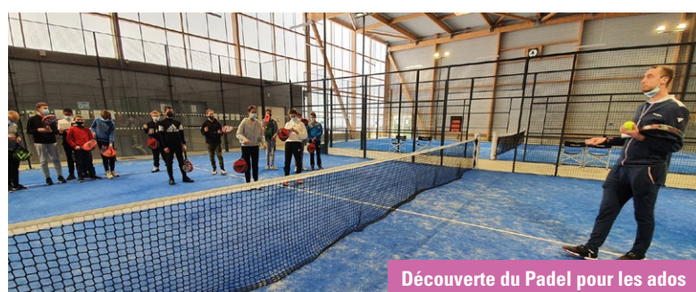
Découverte du Padel pour les ados