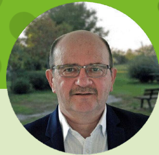
Jean-Noël Chappuis, Maire de Saint-Gervais-la-Forêt