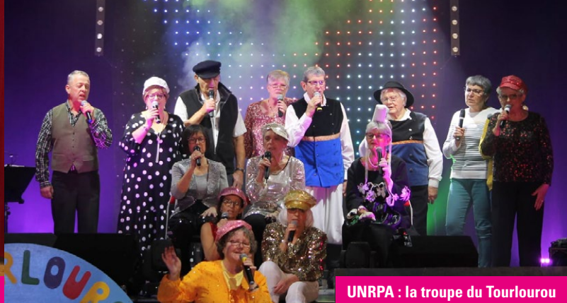
UNRPA : la troupe du Tourlourou