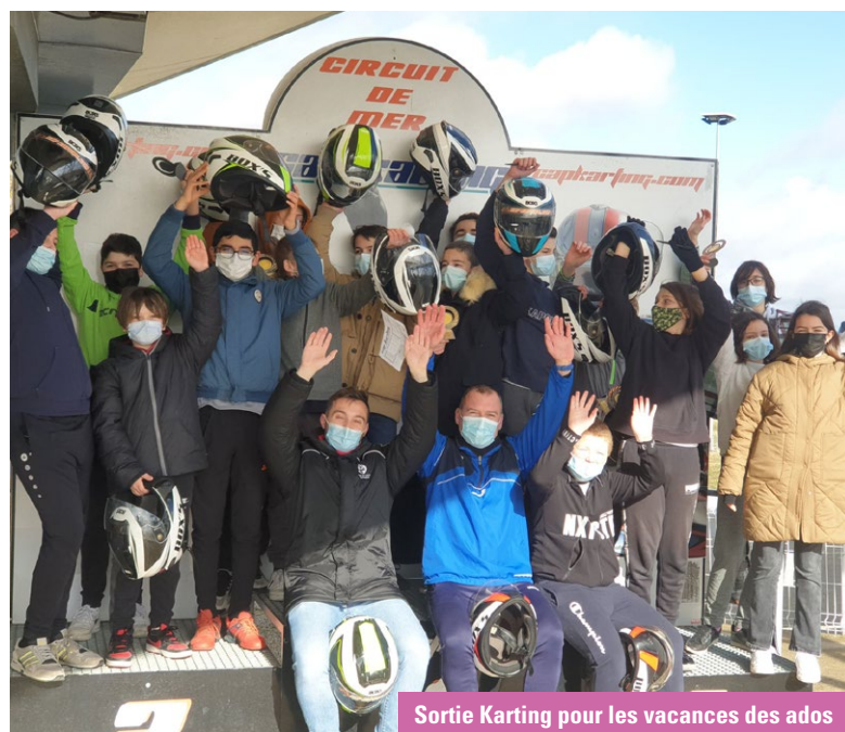
Sortie Karting pour les vacances des ados