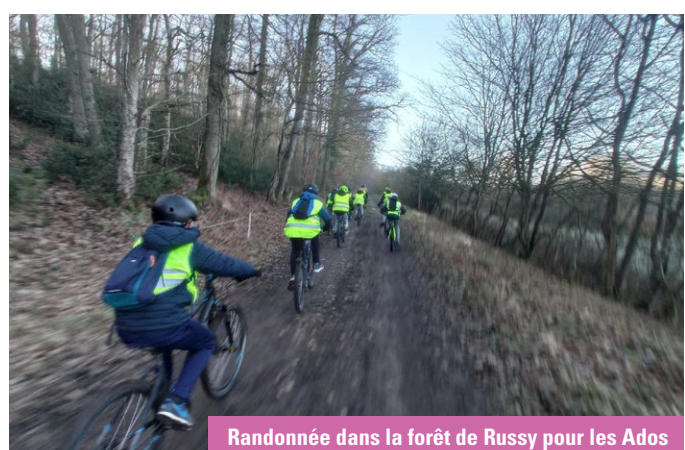
Randonnée dans la forêt de Russy pour les Ados