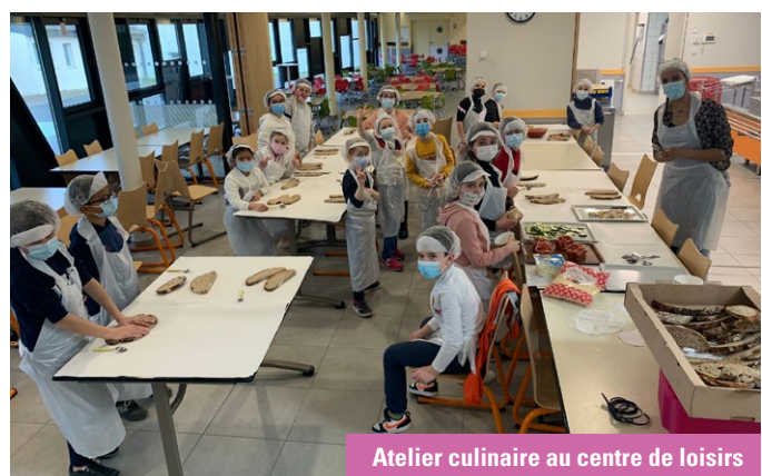
Atelier culinaire au centre de loisirs