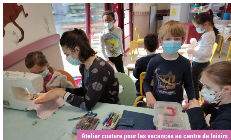
Atelier couture pour les vacances au centre de loisirs