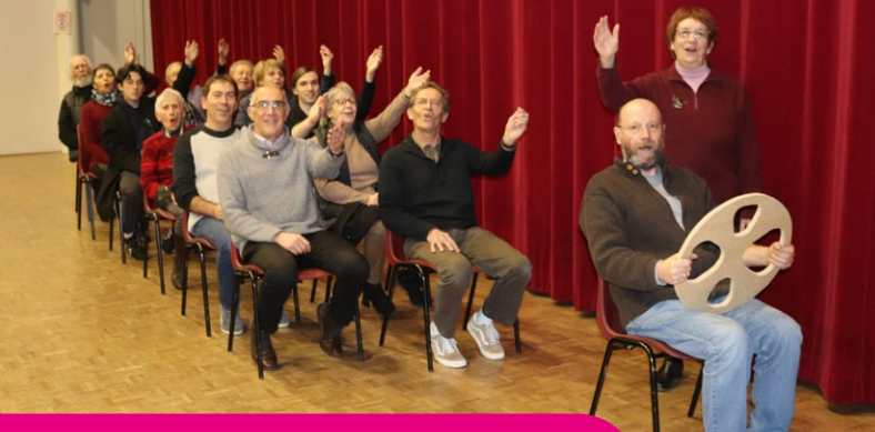
Théâtre du Cercle