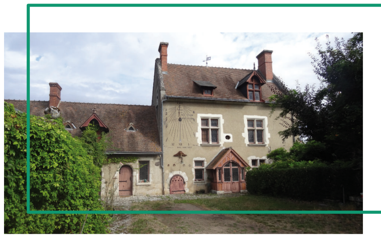
Maison Renaissance (adresse)

Ce parcours est présenté sous forme d'un cheminement en 23 étapes, jalonné de panneaux explicatifs. Vous pourrez, au gré d'une balade de 7,3 km (2h environ), vous imprégner de l'histoire locale, côtoyer Robert-Houdin, le célèbre magicien, ou partager la bonne crème de Saint-Gervais qui a fait la renommée de la commune. Suivez la laitière qui sera votre guide tout au long du parcours.