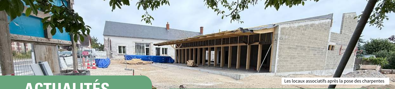
Les locaux associatifs après la pose des charpentes