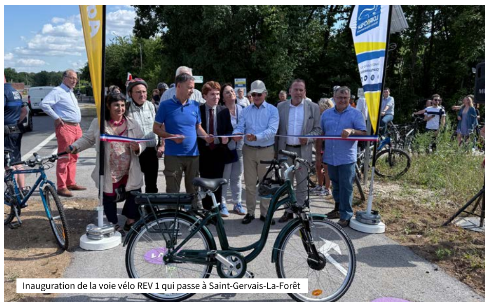
Inauguration de la voie vélo REV 1 qui passe à Saint-Gervais-La-Forêt

De plus les principaux axes routiers possèdent une piste cyclable sur une distance de plus de 3 km.