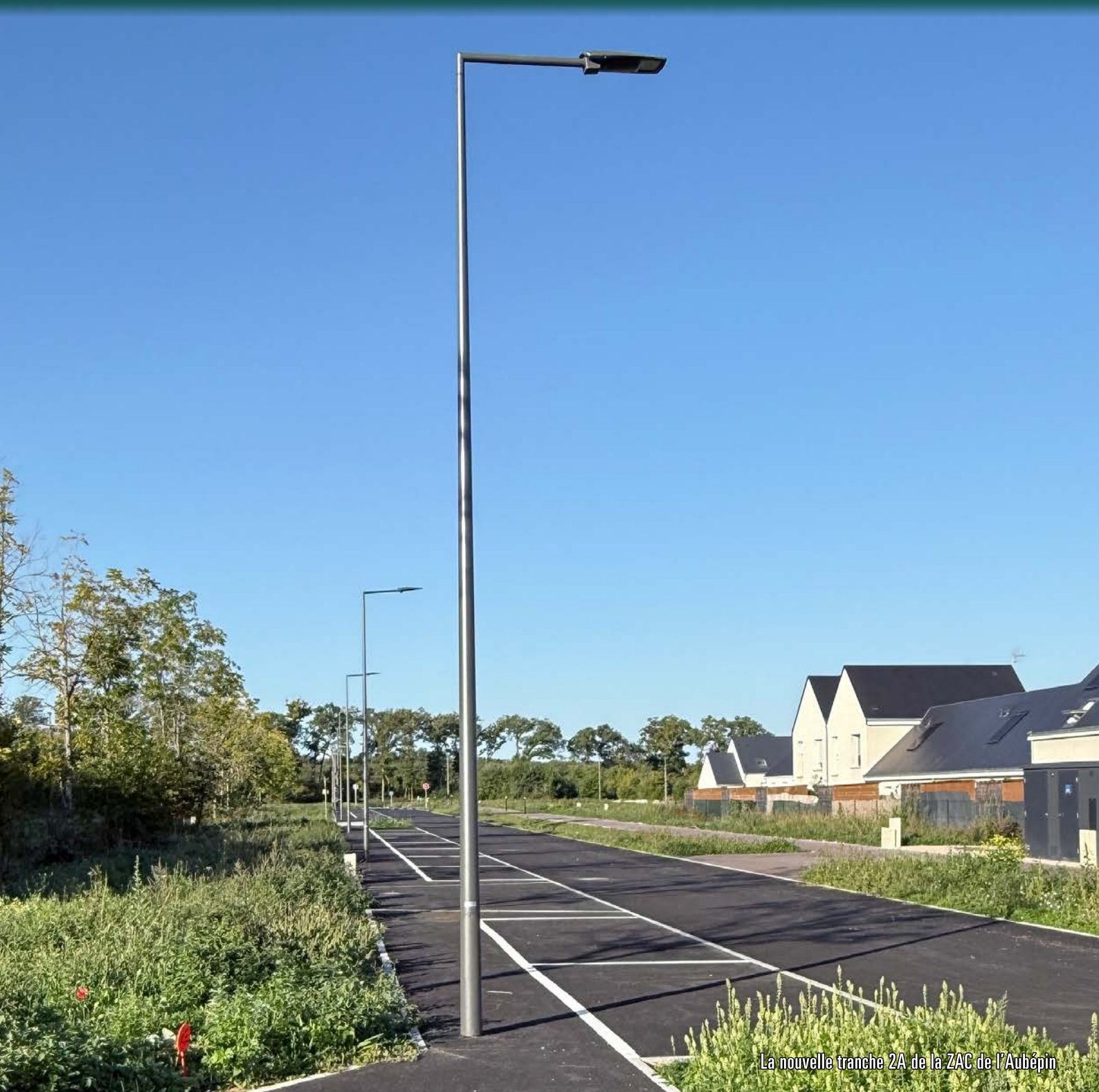
La nouvelle tranche 2A de la ZAC de l'Aubépin